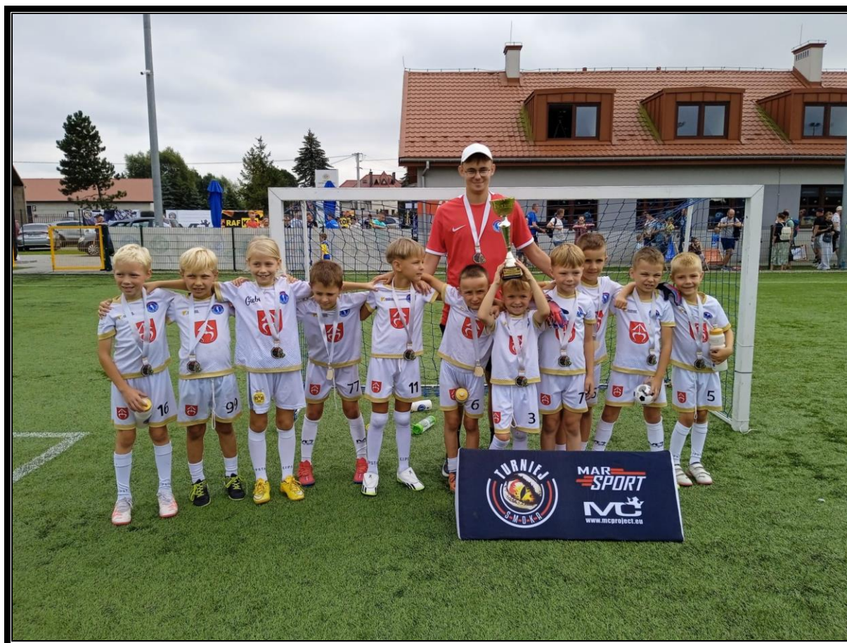
Źródło: portal społecznościowy – Facebook „IAF Iwanowicka Akademia Futbolu& IAF Cheerleaders” [dostęp: 02.01.2026 r.]