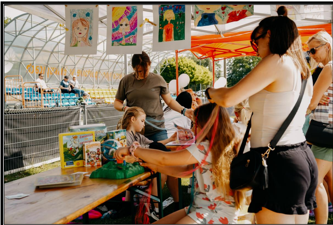
Źródło: portal społecznościowy – Facebook „Gmina Iwanowice” [dostęp: 02.01.2026 r.]