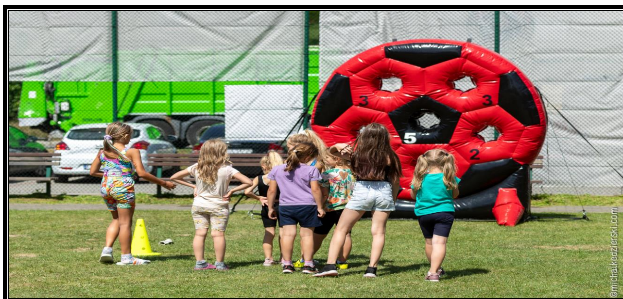
Źródło: portal społecznościowy – Facebook „IAF Iwanowicka Akademia Futbolu& IAF Cheerleaders” [dostęp: 02.01.2026 r.]