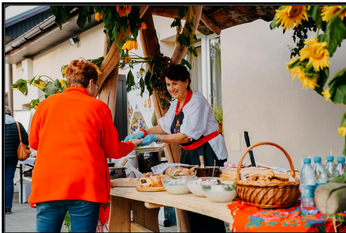
Źródło: portal społecznościowy – Facebook „Gmina Iwanowice” [dostęp: 02.01.2026 r.]